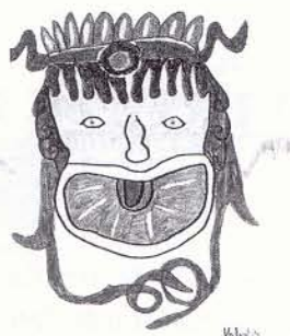
Mosaïque représentant Bacchus

Le foyer s'appelle ainsi car, à l'entracte, le public s'est rassemblé autour d'une grande cheminée centrale. Au plafond, la grande peinture a été peinte par Ernest MICHEL. Elle représente des étoiles d'été avec des femmes. D'autres tableaux montrent la pastorale, la comédie, la poésie, le chant, l'histoire, la musique, la tragédie. Sur le sol, une mosaïque représente Bacchus, le Dieu du vin. Des bals étaient organisés dans ce lieu. Au plafond on peut voir trois médaillons représentant Apollon éclairant le jour, le matin chassant la nuit. Il y a un magnifique trompe-l'oeil qui est une peinture imitant des sculptures. Dans les quatre coins il y a des écussons représentant l'emblème des villes de notre région : Béziers, Sète, St Pons, Lodève.